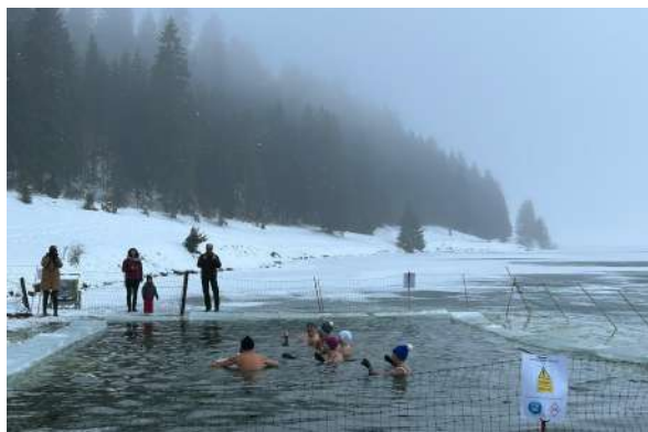
Édition 2023 Baignade dans le lac gelé