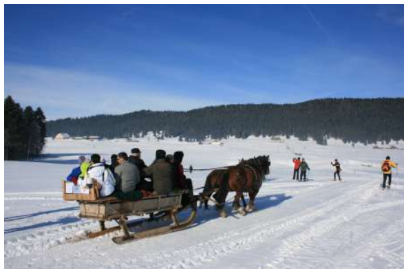
Édition 2013 Balade en traîneau