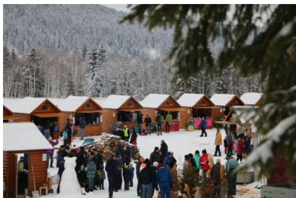
Édition 2018 Village du Froid